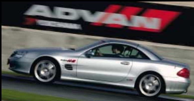
Présentation presse à Dubaï de la gamme ADVAN - V103 sur BRABUS SL 350