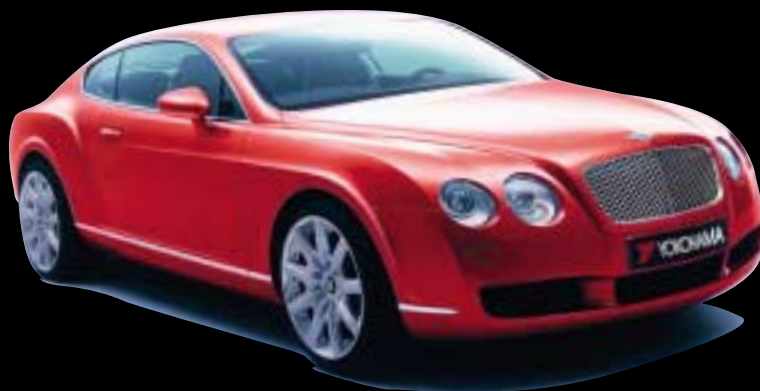
V103 en équipement d'origine 20" sur Bentley Continental GT

Par exemple, le 275/35 ZR 20 est homologué en exclusivité par Bentley sur la Continental GT,